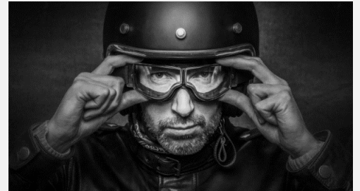
Qualität und Validierung